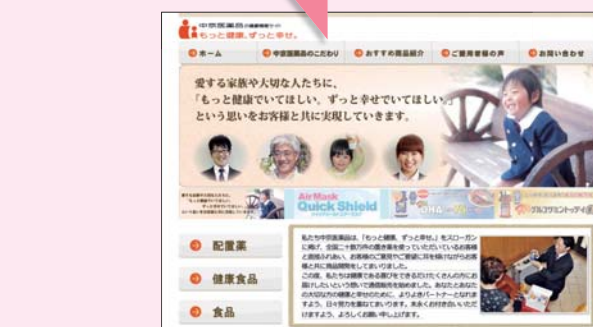
▲「もっと健康、ずっと幸せ」のトップページ