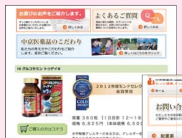
▼「お問い合わせ」のページ