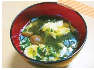
三つ葉の代わりに細切りのほうれん草を使用しました。 具たくさんで、おいしかったです。