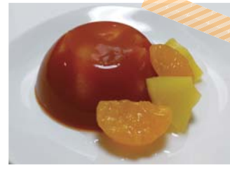
とても手軽に作る事ができました。 アクセントにフルーツを添えてみました。