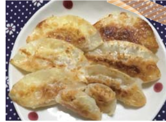
ひきわり納豆を使ってみました。 大葉を加えてみると良いアクセントになりますよ。