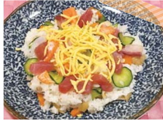
簡単にでき、見た目も華やかですね。 おいしくいただきました。